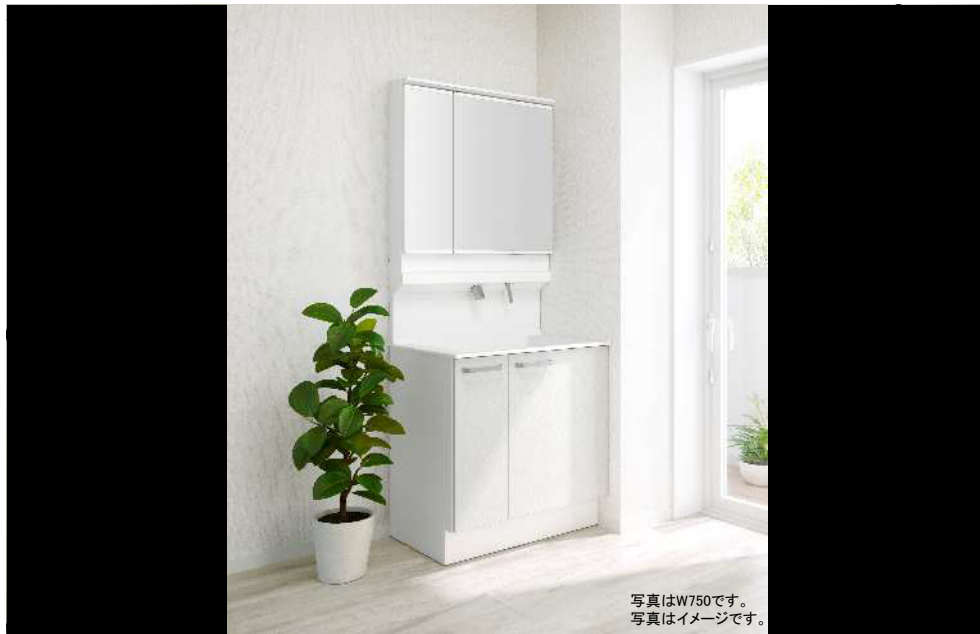
写真はW750です。 写真はイメージです。